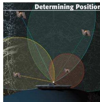
Hình 1 - Hệ thống vệ tinh GPS